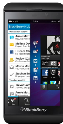
Il BlackBerry Z10: hardware e sistema operativo rinnovati per la riscossa nel 2013.

Il 2013 sarà un anno cruciale per la loro sopravvivenza, durante il quale entrambi i sistemi si giocheranno il tutto per tutto pur di guadagnare e difendere il terzo posto. In tal senso sarà vitale l'orientamento delle aziende, che avranno davanti la scelta di un già consolidato Windows Phone 8 o di un più recente ma molto promettente BlackBerry OS versione 10. Intanto una vittima illustre c'è già: Symbian, la storica piattaforma di Nokia, ha perso il 70% del suo mercato e l'azienda ha già chiarito nell'ultimo report finanziario che non svilupperà più nuovi smartphone di questo tipo.