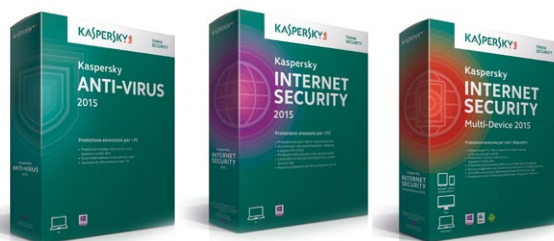
Anti-Virus 2015 Euro 29,95 (1 Pc, 1 anno) Internet Security 2015 Euro 49,95 (1 Pc, 1 anno) Internet Security Multi-Device 2015 Euro 69,95 (3 disp., 1 anno)

K aspersky Lab ha presentato ufficialmente le nuove soluzioni di protezione dedicate al mercato consumer: Anti-Virus, Internet Security e Internet Security - Multi-Device, un'unica licenza per computer Windows e Mac, tablet e smartphone Android, iOS e Windows Phone. Tra le novità, si segnalano alcune funzioni pensate per rispondere alle tendenze più attuali nel settore del malware. Per esempio, un nuovo strumento analizza i processi attivi e verifica le modifiche ai file, per contrastare i criptomalware, virus che cifrano i documenti personali e poi chiedono il pagamento di una somma per ripristinarli. Quando rileva un tentativo di modifica sospetto, il software di sicurezza crea immediatamente una copia di backup del file, e permette quindi di ripristinarne il contenuto in caso di infezione. Molto interessante è anche l'analisi della sicurezza delle reti Wi-Fi. Sempre più spesso, infatti, ci si connette a reti poco affidabili per navigare su Internet; Kaspersky Internet Security verifica la connessione e allerta l'utente in caso di potenziali pericoli, come una connessione vulnerabile oppure l'invio in chiaro di informazioni sensibili. I nuovi prodotti sono aggiornabili, con licenze che coprono un anno dall'attivazione: se durante questo periodo dovesse essere presentata una nuova release, l'upgrade sarà gratuito.