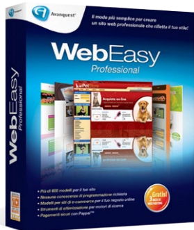
WebEasy 10 Professional Euro 59,95 Iva inclusa

A vanquest ha annunciato il rilascio di Web Easy Professional 10, una soluzione semplice e completa che permette di creare con grande rapidità sofisticati siti Web anche a chi non possiede alcuna conoscenza di programmazione o di Html. A corredo di WebEasy Professional 10 sono forniti oltre 600 modelli di siti di qualità professionale, totalmente personalizzabili, e più di 85.000 immagini liberamente utilizzabili. Il modulo Assistente siti Web, completamente ridisegnato, permette di navigare tra le centinaia di design e di visualizzarli in anteprima in qualsiasi browser. La realizzazione dei siti è semplice e intuitiva: per inserire nelle pagine foto, video, effetti, moduli, oggetti e animazioni è sufficiente trascinarli con il mouse. Il software include strumenti di e-commerce nonché di promozione, di manutenzione e di analisi dei siti, inoltre mette a disposizione 3 mesi di hosting gratuito. Con WebEasy Professional è molto semplice inserire nelle pagine del sito una varietà di servizi molto diffusi (tra cui Google Maps, Facebook, Picasa e Flickr) e creare podcast e Webcast. Da segnalare, infine, che WebEasy Professional permette di realizzare anche siti ottimizzati per iPhone e smartphone.