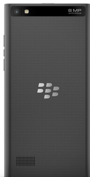
Blackberry Leap Euro 299 Iva inclusa www.blackberry.com

contenitore sempre accessibile, l'efficace tastiera virtuale con funzioni di auto apprendimento e il Blackberry Assistant, gestibile direttamente anche con comandi vocali,