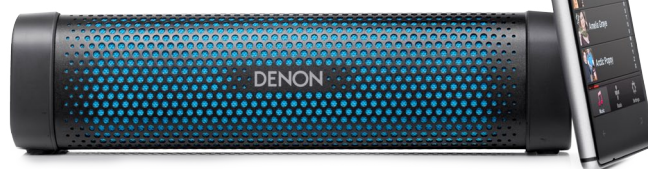
Denon Envaya Mini

Proprio in quest'ultima si è infatti distinto il Mifa F1, tra i più compatti della rassegna, economico ma in grado di stupire per caratteristiche, volume e resa sui bassi. Viste le sue qualità, l'F1 è la soluzione perfetta per chi cerca il massimo in portabilità. All'estremo opposto, nella fascia top della rassegna si sono invece distinti il Denon Envaya Mini e il Creative Sound Blaster Roar. Entrambi suonano molto bene: il Denon eccelle in gamma bassa nonostante le dimensioni compatte, mentre il Creative, più pesante e voluminoso della media, vanta caratteristiche e funzioni uniche che lo rendono estremamente versatile e performante sotto tutti i punti di vista.