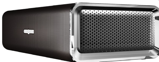
Creative Sound Blaster Roar

19 prodotti diversi e complementari: a voi la scelta della soluzione perfetta, che più si adatta alle vostre esigenze.