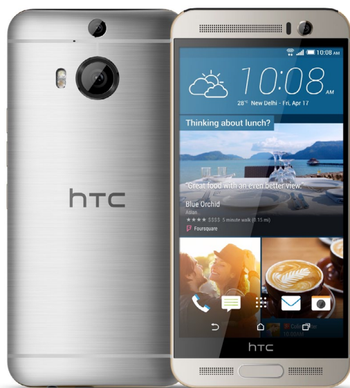
Htc One M9+